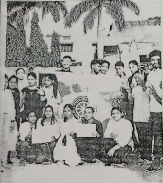
One Day Camp

फिट इण्डिया रन कार्यक्रम के तहत प्रातः काल में स्वयंसेवियों द्वारा किया खेल-कूद एवं व्यायाम (दिनांक-20/10/22)