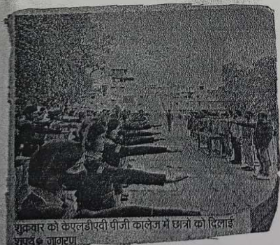
शुक्रवार को कपलडीएवी पीजी कालेज में छात्रों को दिलाई शपथपत्र जागरण